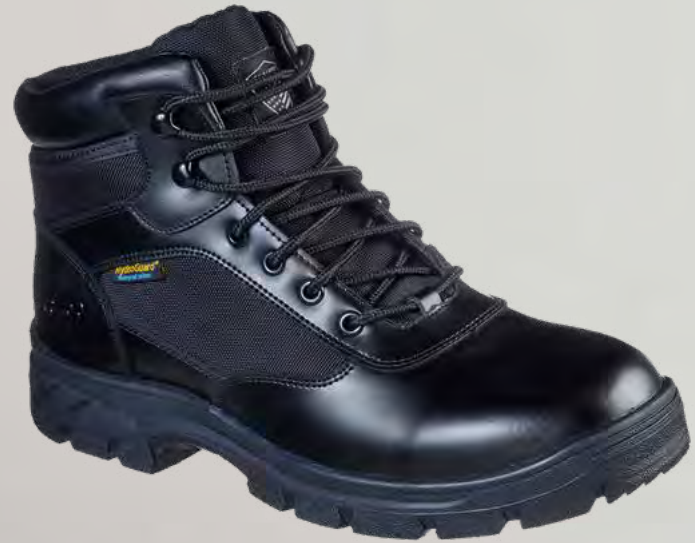
REF. SK77526EC WASCANA - BENEN WP