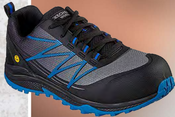
REF. SK200046EC PUXAL COMP TOE