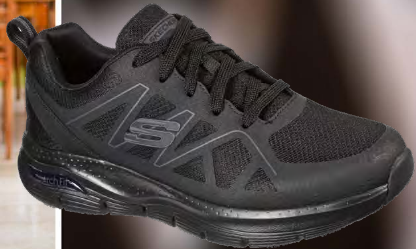
SK200025EC ARCH FIT SR - AXTELL