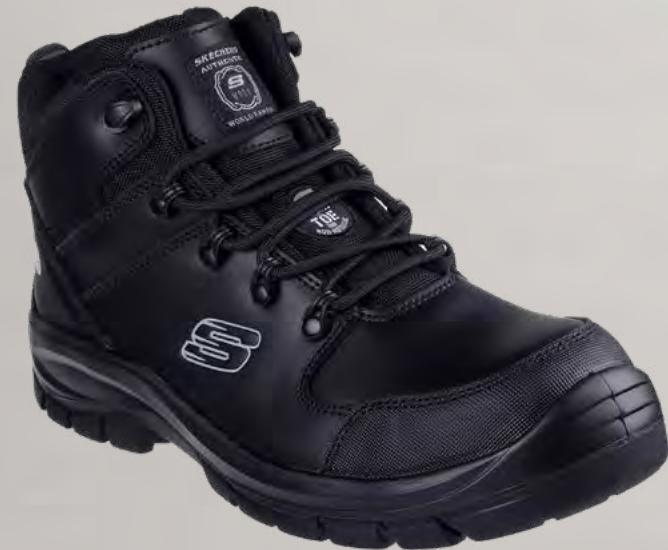
REF. SK200187EC TROPHUS - PENDING