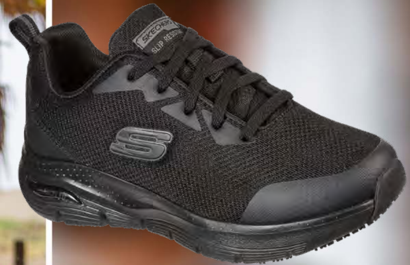
SK108019EC ARCH FIT SR