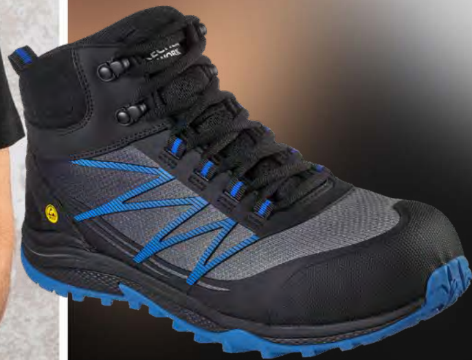
REF. 200047EC PUXAL FIRMLE