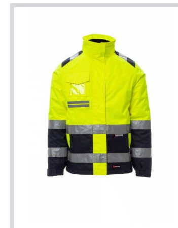
AMARELO FLUO/AZUL MARINHO