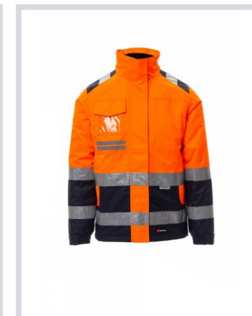
LARANJA FLUO/AZUL MARINHO